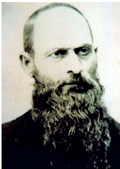
馬偕博士 George Leslie Mackay 1844.3.21~1901.6.2，偕叡理