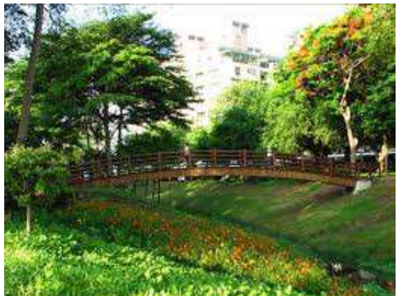
巴克禮紀念公園（台南）