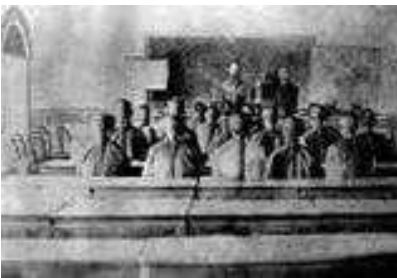
馬偕在牛津學堂授課