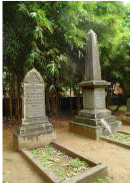
馬偕之墓（淡江中學）